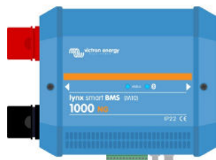
Lynx Smart BMS NG 500 A et 1000 A