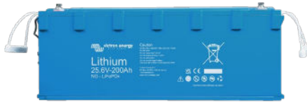
Batterie Lithium NG 25,6 V 200 Ah