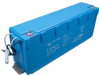
Fixé avec des supports de montage