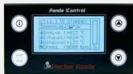
Ecran digital Panda iControl